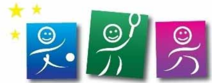
Erasmus Sports Programme

Desde el 9 de diciembre tutelamos 4 proyectos de participantes, dos en Italia y dos en Bilbao, que se implementarán en 2020.